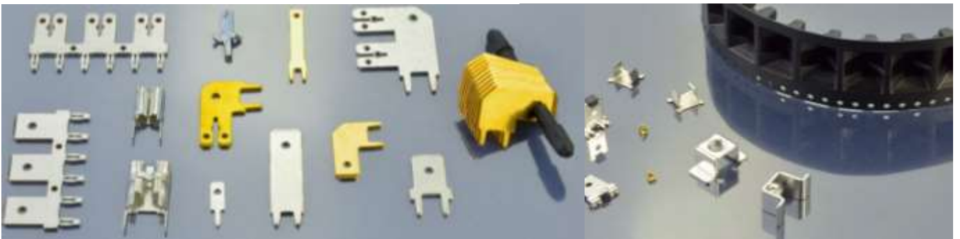
Standardbauelemente in THT- und SMD-Technik

Beide Unternehmen bieten sowohl klassische THT- als auch SMD-Bauelemente an.